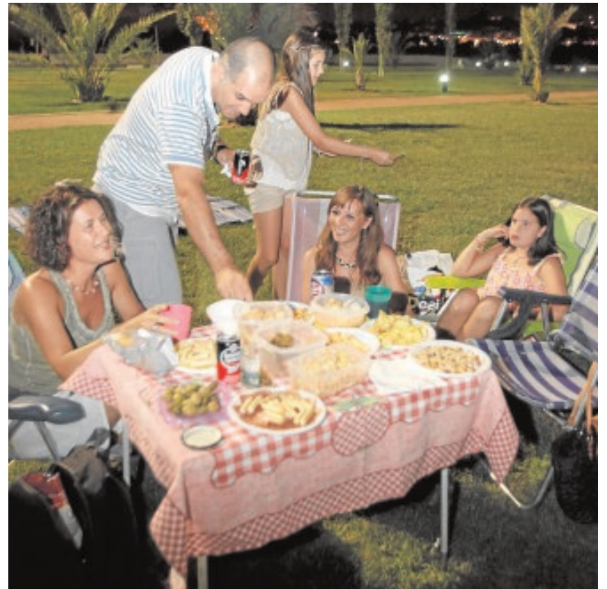
Una familia durante la celebración de un picnic

En segundo lugar, después de los depósitos, los catalanes apuestan por los fondos de inversión, según el 44% de los asesores encuestados en Cata-