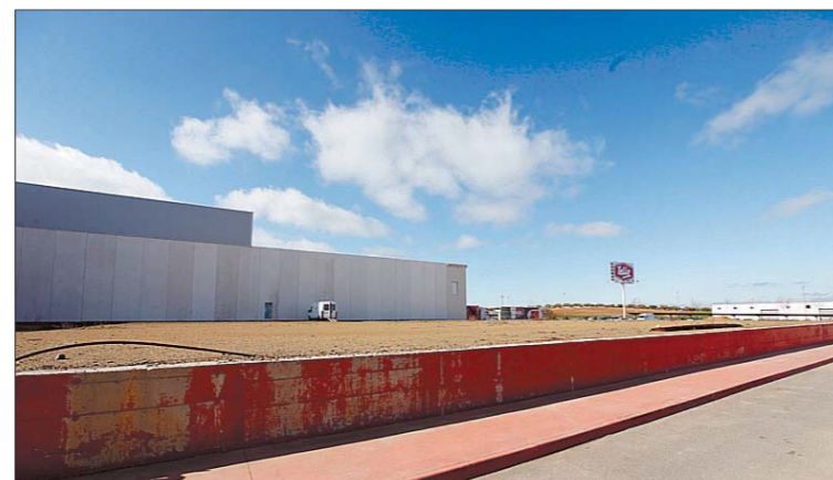
Tello se encuentra ubicada en el término de Totanés.

La inversión de 33 millones supondrá la creación de entre 150 y 200 empleos