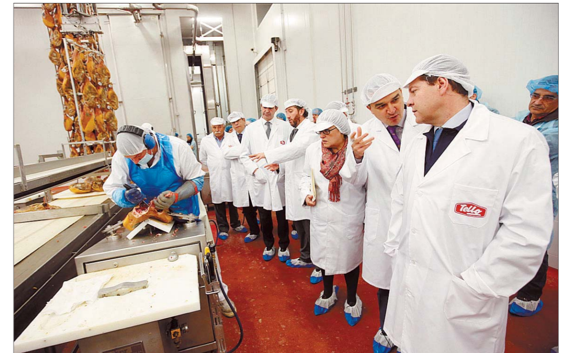
El presidente pudo ver in situ cómo los profesionales deshuesan un jamón en unos instantes.

García-Page hacía estas declaraciones durante la visita que realizaba a la empresa de jamones y carnes Tello, en Totanés, donde alababa el carácter de la familia de empresarios, especialmente de los descendientes del creador, «que han mamado un buen código de conducta, cultivando la base del esfuerzo». Y es que el presidente regional tiene claro que la economía funciona mejor si hay valores que la sustenten. De este modo, «la única forma de salir de la crisis y no volver a caer, es teniendo valores, civilizando los