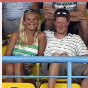
Chelsy Davy se cansa del príncipe Enrique