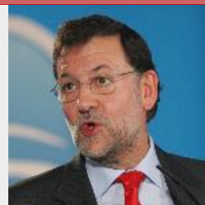
Rajoy se compromete a garantizar la unidad del PP