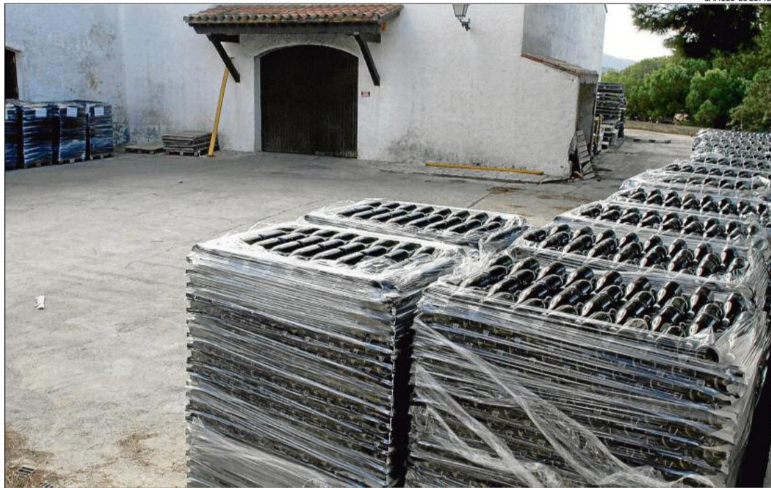
Palets amb ampolles de cava buides al pati exterior de Mont-Ferrant, a Blanes.