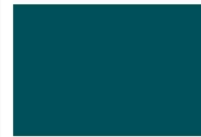
La estrategia del M&G Dynamic Allocation Fund

This page requires a Javascript-enabled browser.