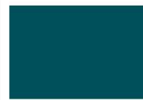
La visión del gestor del M&G Global Basics