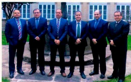
Los presidentes de las seis asociaciones que forman CIAC.

de no exista ninguna». Asimismo, se han creado seis comisiones de trabajo cuyos resultados serán consensuados entre todas las asociaciones. (CB)