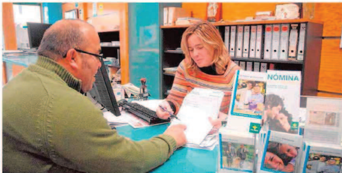
Un cliente revisa el contrato de apertura de un depósito. :: B. FERNÁNDEZ

millones figuraban en las cuentas corrientes de particulares y pymes a mediados de este año.