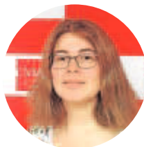
Raquel García CNMV

«Hay que intensificar la participación de las instituciones públicas y privadas en el fomento de la educación financiera. Se trata de una asignatura que hay que estudiar durante toda la vida»