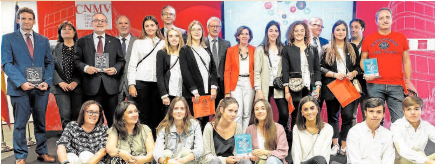
Foto de familia de los ganadores del Concurso de Conocimientos Financieros y del Premio Finanzas para Todos, junto a representantes del Gobierno, del Banco de España y de la Comisión Nacional del Mercado de Valores.

Todos a las mejores iniciativas de educación financiera realizadas en nuestro país. Los premiados fueron 'Finanzas para mortales', por su labor de promoción de la educación financiera en España, y el 'Proyecto Bases' de la Cooperativa de Maestros Melilla, desarrollado en el Colegio Enrique Soler de la ciudad autónoma.